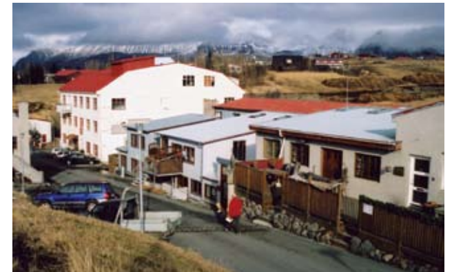
Húsin í brekkunni eftir þrotlausu vinnu við að gera upp

Íslands. Mikil gleði og bjartsýni ríkti þegar ullarþvottahúsið var rífið. Loks kom aðgengi fyrir alla að fossinum. Planið bakvið húsin í brekkunni var til þess ætlað að almenningur gæti haft þar viðkomustað, sest niður og notið gömlu bygginganna, sögunnar og fossins. Túrístarnir kæmst óhultir að fossinum og börnin fengu tækifæri til að veiða í hylnum. Því miður var gleðin skammvinn því mánuði síðar