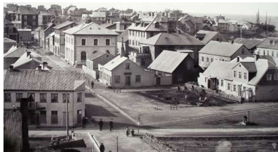
Miðbær Reykjavíkur við upphaf 20. aldar

henni. Gert er ráð fyrir bilastæðum áfram, minni akreinum og hægari umferð í gegn. Þetta er mikilvæg tenging norður suður, en með breytingunum myndast skemmtilegra svæði fyrir gangandi vegfarendur.