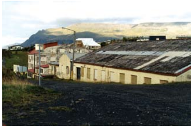
Svona var umhorfs í Álafossbrekkunni áður en íbúar hófust handa

Nokkru áður en okkur var bent á að hér væri iðnaðarhúsnæði til sölu, hafði mig dreymt draum þar sem ég var í heimsókn hjá kunningjahjónum í Tangahverfi. Í draumnum vekja þau mig árla morguns. Komdu með okkur, við ætlum að sýna þér fegursta stað á jarðríki. Þau ganga með mig á milli sín í austurátt, þar sem sólin var að rísa. Neðst við leirurnar stóð hamraborg úr hrauni, líkt og fjölþýlishús. Niður mosavaxið