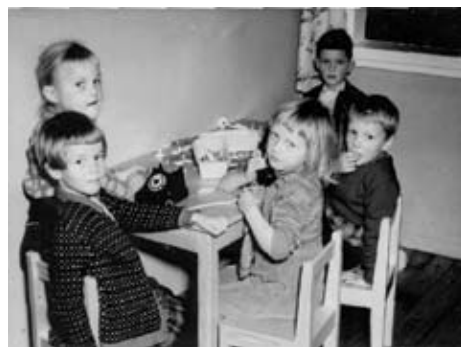
Barnaheimili rekið í tengslum við ullarverksmiðjuna á 7. áratugnum

Íslensku gólfteppaverksmiðjurnar hættu rekstri eftir að samkeppni jókst í kjölfar inngöngu í EFTA á áttunda áratugnum, en að Álafossi var lengst af ofið fyrir fyrirtæki og ríkisstofnanir, aðallega sérstök munstur. Félagslíf, íþróttir og menningarstarf